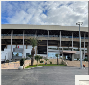
Stade Moulay Abdellah

La 1ère promotion du Master 1 MOST de l'Université de Limoges s'est rendue au Maroc à la rencontre des étudiants du Master 1 MSGOS de l'Institut des Sciences et du Sport de Settat.