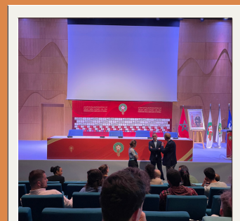
Fédération Royale Marocaine de Football

Les étudiants du Master MOST de Limoges remercient chaleureusement toutes les institutions ainsi que leurs représentants pour leur accueil ainsi que les nombreux échanges.